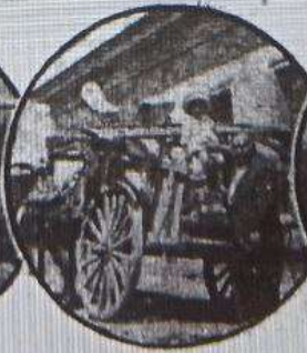
D. Tomás Arestizábal llevándose de su casa lo que quedó en buen estado.