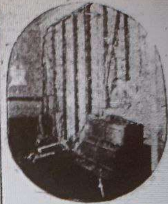
Cómo quedó la oficina de la Compañía Inglesa de Minas.