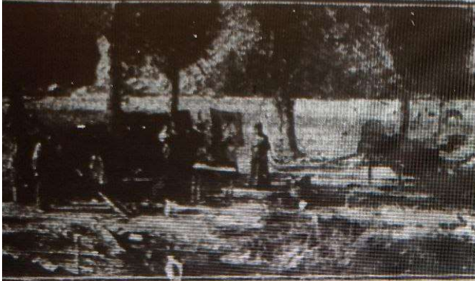
Familias que viven bajo los árboles, en los alrededores.