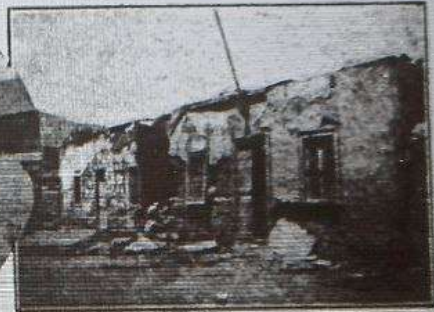
Cómo quedaron las casas del final norte de la calle Yumbel.