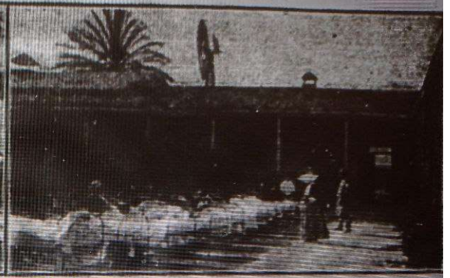
Los enfermos del Hospital a toda intemperie.