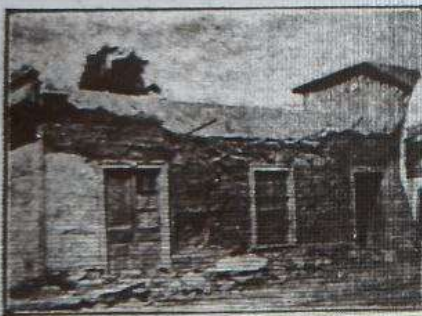
Casa de la sucesión Cambiaso, en la calle Carreras, esquina de Vallejo.