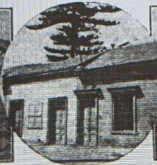
Casas N.º 1026 y 1028 de calle Carreras. Poco sufrieron por fuera, pero en su interior pereció aplastada la señora V. de Fraga.