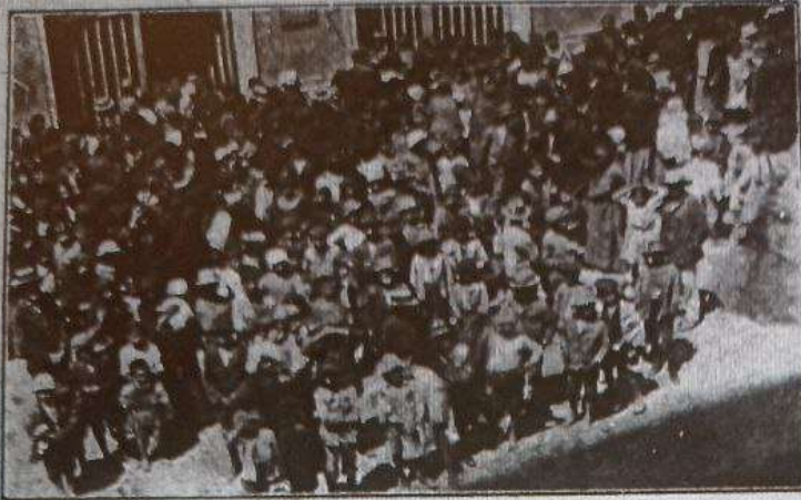
Dañificados esperando el reparto de socorros.